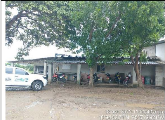
FOTO No. 1 Tomada el 18 de octubre de 2022 Observaciones: Área de oficinas