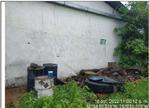
FOTO No. 3 Tomada el 18 de octubre de 2022 Observaciones: Área de almacenamiento de aceite (izquierda) y chatarra (derecha)