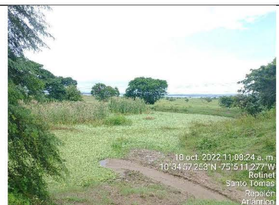
FOTO No. 9 Tomada el 18 de octubre de 2022 Observaciones: ubicación “jagüey” o laguna de sedimentación en coordenadas: 10°34'57,00” N - 75°5'10,81” W