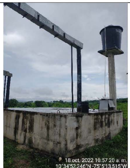
FOTO No. 6 Tomada el 18 de octubre de 2022 Observaciones: Canal de conducción y tanque de almacenamiento de agua lluvia en concreto, motobomba y tanque elevado.