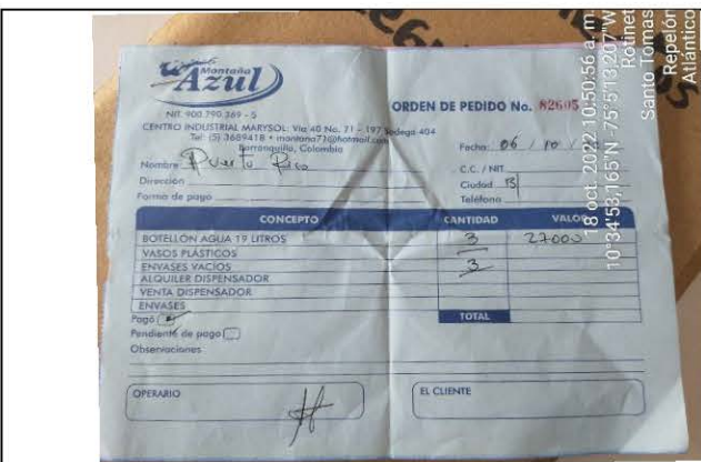
FOTO No. 5 Tomada el 18 de octubre de 2022 Observaciones: Certificado de compra de agua potable (botellones)