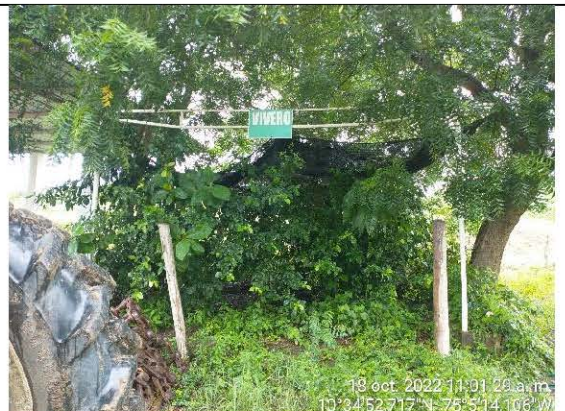
FOTO No. 4 Tomada el 18 de octubre de 2022 Observaciones: área destinada para el vivero (esta revegetalizada naturalmente)