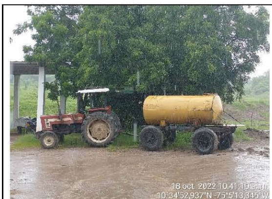
FOTO No. 7 Tomada el 18 de octubre de 2022 Observaciones: Tractor y tanque para transportar agua captada del “jagüey”, mecanismo de riego de vías internas en época de sequía.