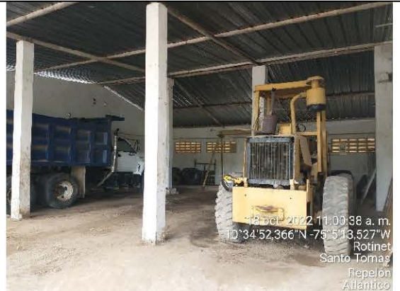
FOTO No. 2 Tomada el 18 de octubre de 2022 Observaciones: Parqueaderos para maquinaria de la cantera