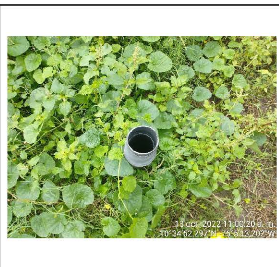
FOTO No. 10 Tomada el 18 de octubre de 2022 Observaciones: Ubicación poza séptica a donde son vertidas las ARD