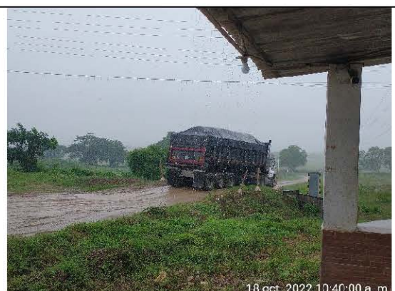
FOTO No. 8 Tomada el 18 de octubre de 2022 Observaciones: Vehículos carpados