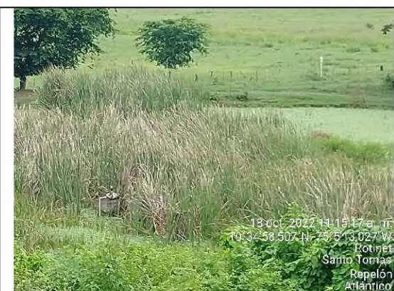
FOTO No. 10 Tomada el 18 de octubre de 2022 Observaciones: Estructura (motobomba), ubicada en el “jagüey”.