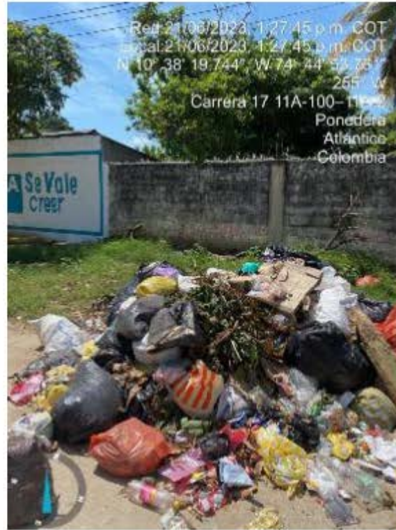
Foto No.1 Disposición de residuos a cielo abierto.

POR MEDIO DEL CUAL SE FORMULA UN PLIEGO DE CARGOS EN CONTRA DEL MUNICIPIO DE PONEDERA, IDENTIFICADO CON EL NIT 890.116.278-9