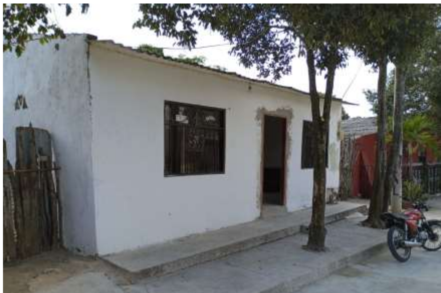
Imagen 1: Vivienda ubicada en la Calle 2ª No. 18 – 26 Puerto Giraldo - Atlántico